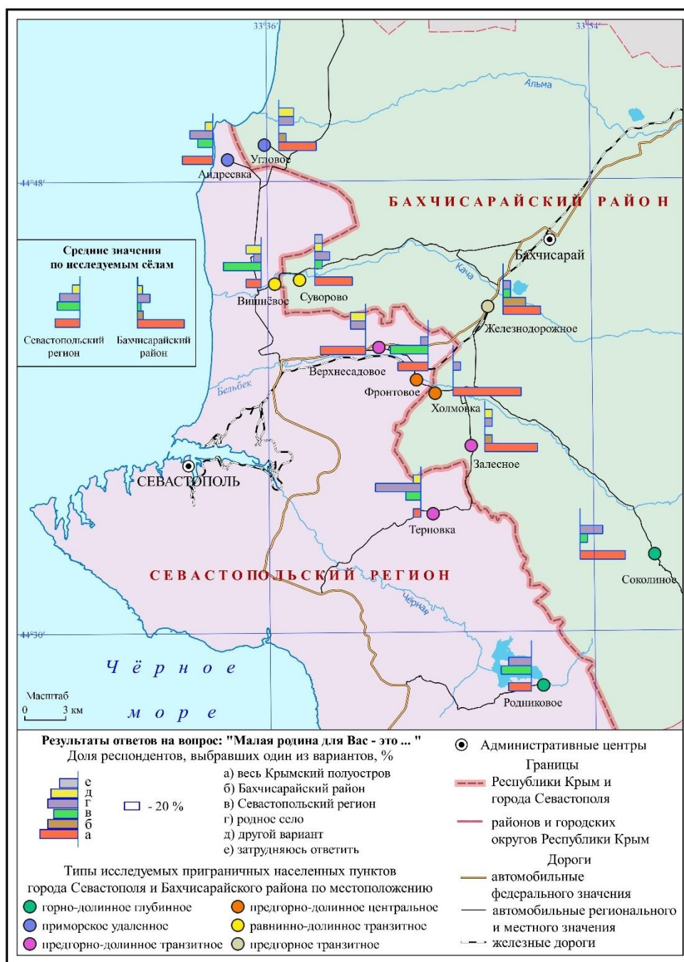
Рис. 1. «Малая родина» в представлениях жителей внутрикрымского приграничья Fig. 1. "Small motherland" in the perception of the Crimean border line residents

Респондентам по обе стороны внутрикрымской административной границы задавался вопрос: «Для вас Севастопольский регион является особой территорией или частью всего Крыма?» 61,7 % опрошенных считают Севастопольский регион частью всего Крыма, треть респондентов выделили его в особую территорию.