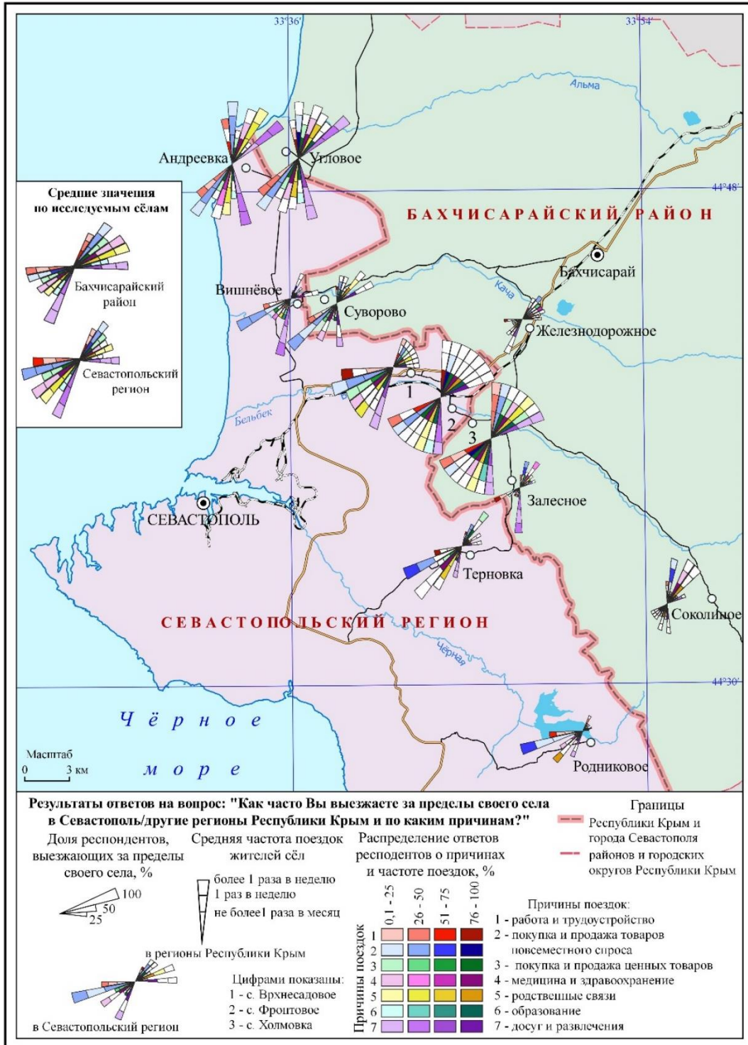
Рис. 3. Причины и частота поездок жителей приграничных сёл Севастопольского городского региона и Бахчисарайского района Fig. 3. Reasons and frequency of trips of residents of border villages of the Sevastopol urban region and Bakhchisarai district

Севастопольского регионального рынка труда, установленные одним из авторов статьи ещё в 2000 г. [Воронин, 2000]. В сферу трудового притяжения Севастополя попадают практически все приграничные населённые пункты, территориально входящие в современный Бахчисарайский муниципальный р-н.