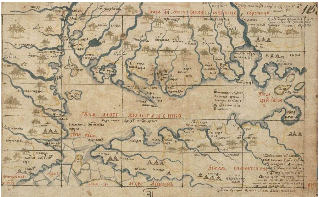
Рис. 3. Чертёж Ремезова «Море Мангазейско с урочищи» (север внизу)