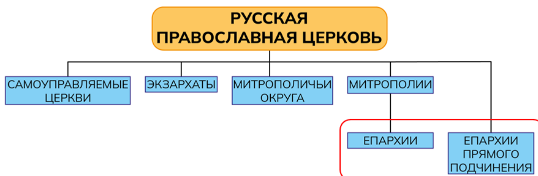
Рис. 1. Административно-территориальное деление РПЦ. Красным очерчены объекты исследования и картографирования. Fig. 1. Administrative and territorial division of the Russian Orthodox Church. Objects of research and mapping are outlined in red

для социально-экономического развития всей страны. К тому же границы епархий являются более дробными, чем границы субъектов РФ, они более тесно учитывают территориальные различия, социально-экономические и этнокультурные особенности.