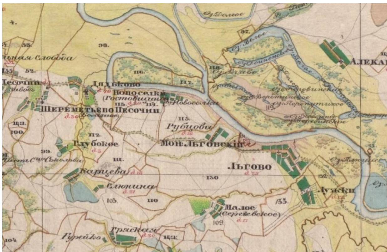
Рис. 1. Исследуемый район на карте А. И. Менде. М-б 1:84 000 Fig. 1. The research area on the map of A. I. Mende. Scale 1:84 000

Дядьков (совр. Дядьково ). На картах межевого атласа А. И. Менде 1849–1850 гг. название фиксируется в форме Дядьково (карта Рязанской губернии 1849–1850 гг., данные см. выше) (рис. 1). Топоним не упоминается в памятниках письменности древнерусского времени по отношению к рязанской территории, но, по всей видимости, в это время в Поочье уже существовал г. Дядьков вместе с городами Переяславль , Льгов , Борисов-Глебов и Вышгород . На это указывают косвенные лингвистические и археологические признаки.