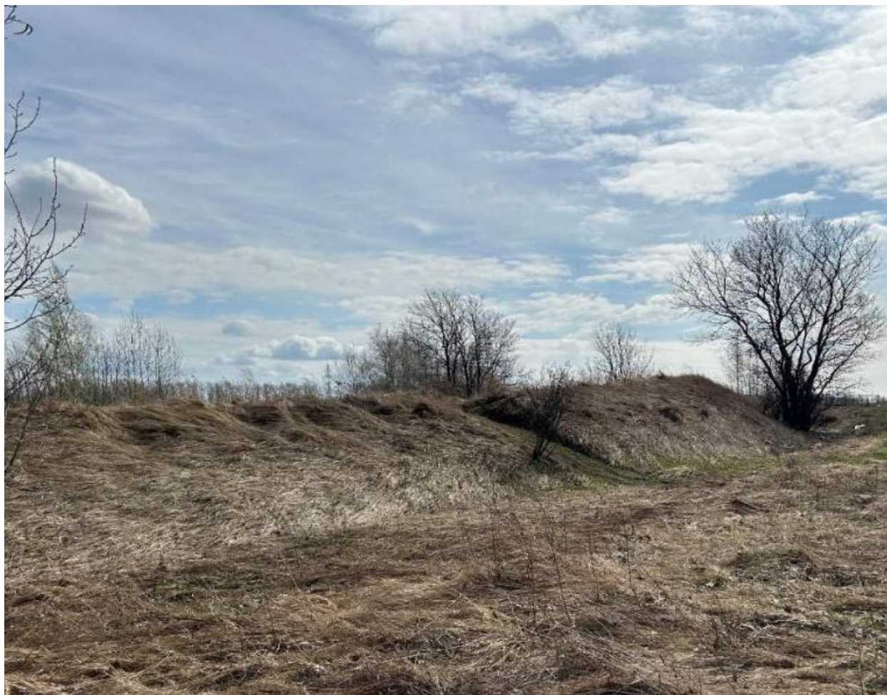
Рис. 3. Дядьковское городище, остатки вала Fig. 3. Dyadkovskoye settlement, remains of the rampart