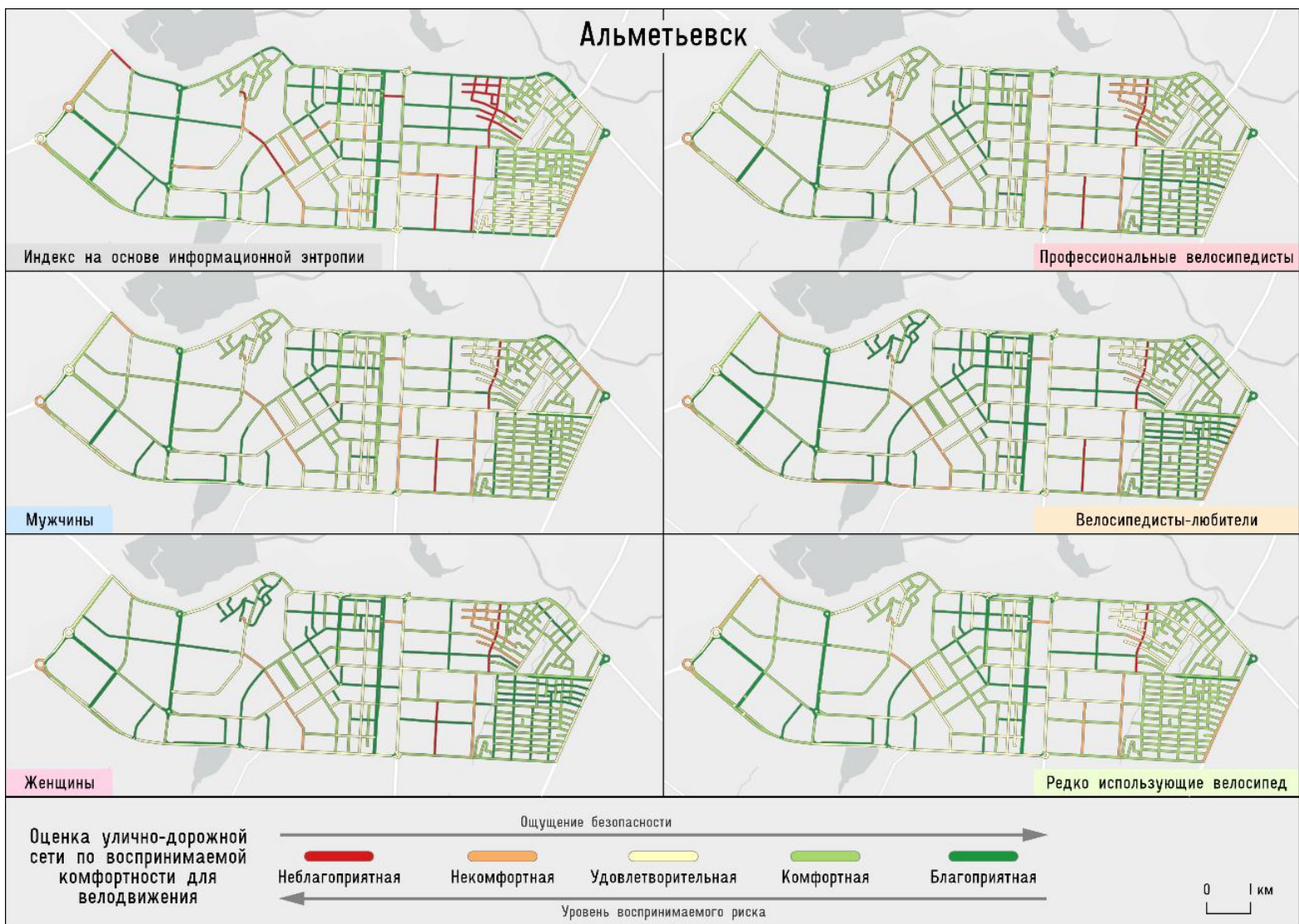
Рис. 2. Карта оценки комфортности улично-дорожной сети для велодвижения в г. Альметьевске Fig. 2. The map of comfort estimation of street network for cycling in Almet'yevsk