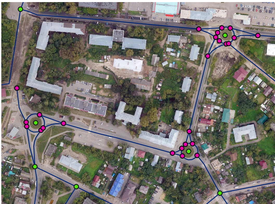
Рис. 1. Пример преобразования исходных графовых вершин (розовые) в вершины перекрестков (зеленые)

Помимо оценки линейной составляющей графа улично-дорожной сети необходимо также оценить перекрестки, которые вносят существенное влияние на ощущение безопасности во время движения. Согласно исследованиям, около трети всех дорожно-транспортных происшествий между автомобилями и велосипедистами происходит именно на перекрестках, причем почти половина таких инцидентов заканчивается смертельным исходом для велосипедистов [Deliali et al., 2021]. С точки зрения правил дорожного движения перекресток определяется как площадной объект пересечения более двух проезжих частей, для оценки они упрощались до точки, которая может считаться условным центром этого полигона. Для их получения исходные вершины графа агрегировались вручную, «висячие» вершины тупиков при этом исключались (рис. 1).