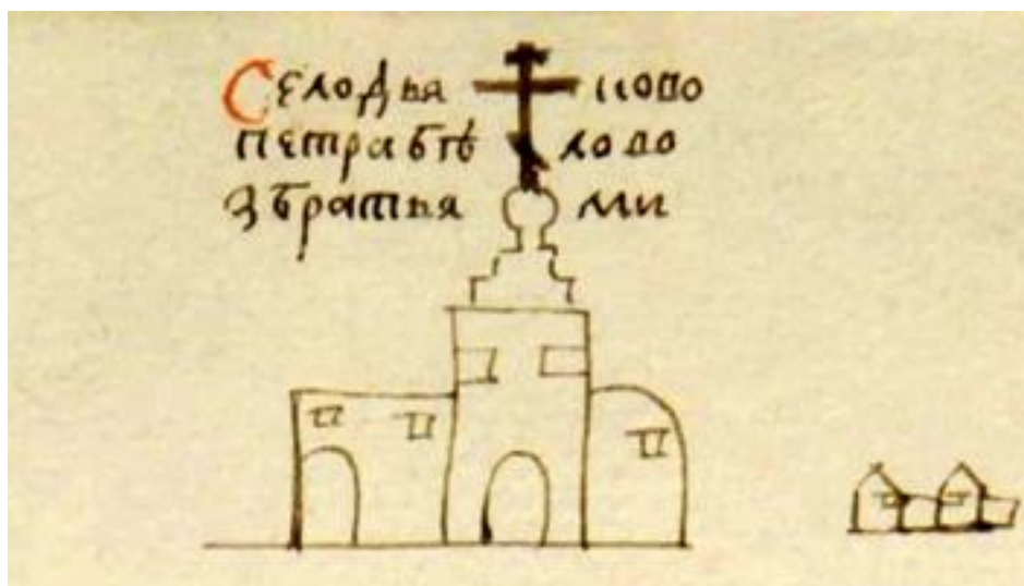
Рис. 1. Фрагмент чертежа с изображением села Дьякова Fig. 1. Fragment of the drawing with the image of the rural Dyakovo

2. Единственно успешной оказалась попытка определения даты составления изучаемого чертежа, основанная на использовании сведений об имущественной принадлежности отображённых на нём объектов. Однако этот успех явился едва ли не случайным вследствие того, что необходимые для решения поставленной задачи сведения оказалось возможно получить для владельца лишь одного из изображённых на чертеже объектов — села Дьякова. Фрагмент датируемого чертежа с изображением с. Дьякова приведён на рис. 1.