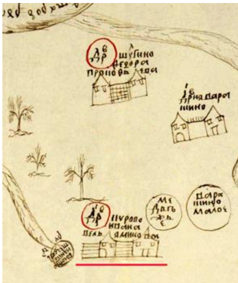
Рис. 2. Фрагмент чертежа с изображением деревни Курово Fig. 2. Fragment of the drawing with the image of the village Kurovo

Обнаруженные сведения ещё о 3-х персонах лишь позволили установить непротиворечие их выполненному определению. Фрагмент датируемого чертежа с изображением одного из таких объектов, а именно «деревня Курово Ивана Вельяминова», приведён на рис. 2.