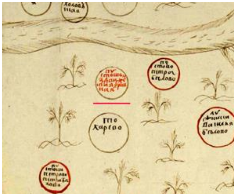
Рис. 3. Фрагмент чертежа с изображением пустоши Воздвиженской Fig. 3. Fragment of the drawing with the image of the desert Vozdvizjenskaja

В материалах [Холмогоровы, 1881, с. 92] в отношении этого села и расположенного на его территории храма приведены следующие цитаты из дозорных книг церковных пустых земель Рузского уезда 1628 г.: «... написано: В сельце Никольском Храм стоит пуст...». В этих же материалах содержатся указания на то, что на рубеже XVI и XVII вв. в ходе «Смуты земли Русской» и село, и располагавшийся на его территории храм были разрушены настолько, что «... невозможно установить места их прежнего нахождения...». В следующий же раз и поселение, имеющее тип «село», и расположенный на его территории храм, освящённый во имя Святителя и Чудотворца Николая, упоминаются в документах, начиная только с 1678 г.