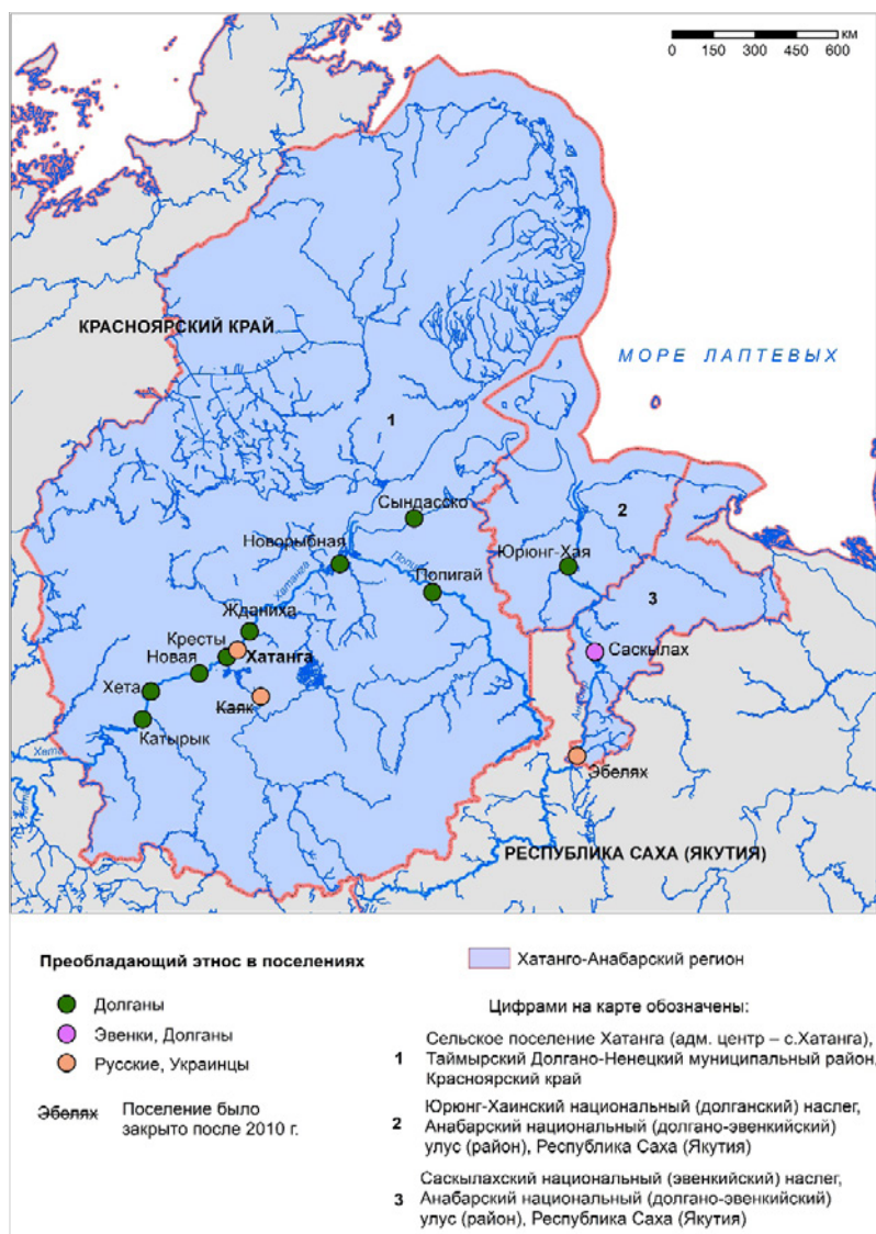
Рис. 1. Месторасположение Хатанго-Анабарского региона (составлено автором, 2021)

Хатанго-Анабарский регион включает в себя территории двух районов разных субъектов России, входящих в арктическую зону страны. Это Анабарский национальный (Долгано-Эвенкийский) улус (район) и сельское поселение Хатанга (бывший Хатангский район) Таймырского Долгано-Ненецкого муниципального района Красноярского края (рис. 1).