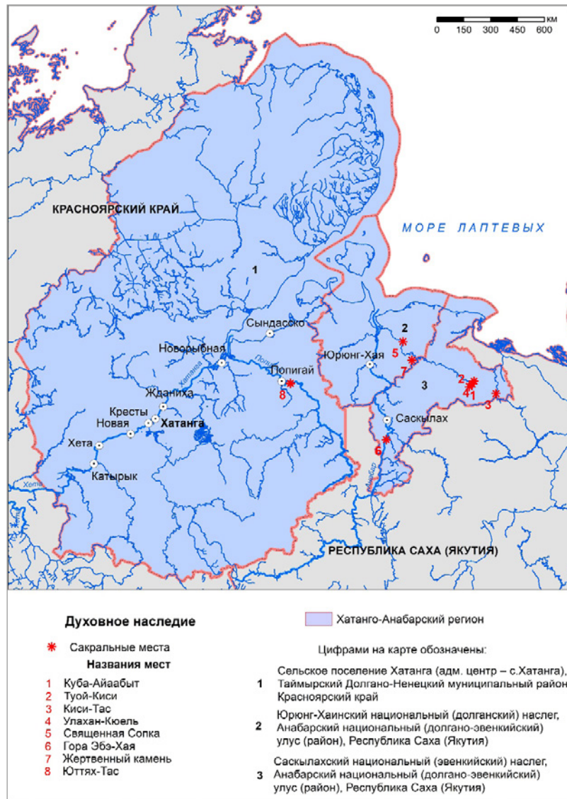
Рис. 3. Сакральные места коренных малочисленных народов Севера Хатанго-Анабарского региона (составлено автором, 2022 г.).