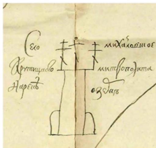
Рис. 8. Фрагмент чертежа № 345. Пример указания духовных званий персон, являющихся владельцами объектов. Надпись на фрагменте: «Село Михайловское Крутицкого Митрополита. На реке Озерне» Fig. 8. Fragment of drawing No. 345. Example of indicating the spiritual titles of persons who are the owners of objects. The inscription on the fragment: «The rural of Mikhailovskoye of the Metropolitan Krutitsky. On the Ozerna River»

Fig. 7. Fragment of drawing No. 343. Examples of indicating the ownership of objects by the palace department and the characteristics of objects. Inscriptions on the fragment (from left to right): «The Poboinka river», «The wasteland of the Sovereign's palace. Poboische», «The road to the rural Mikhailovskoye»