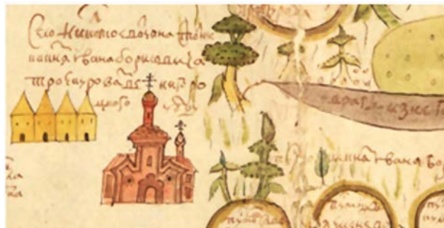
Рис. 6. Фрагмент чертежа № 342. Пример указания персональных сведений владельцев объектов. Надпись на фрагменте (справа): «Село Никольское. Вотчина Стольника Князя Ивана Борисовича Троекурова. Звенигородского уезда»

Fig. 5. Fragment of drawing No. 369. Example of specifying the locations and owners of objects belonging to the subjects of the Spiritual Department. The inscription in the center of the fragment: «The arable land of the Voskesenskiy Monastery»