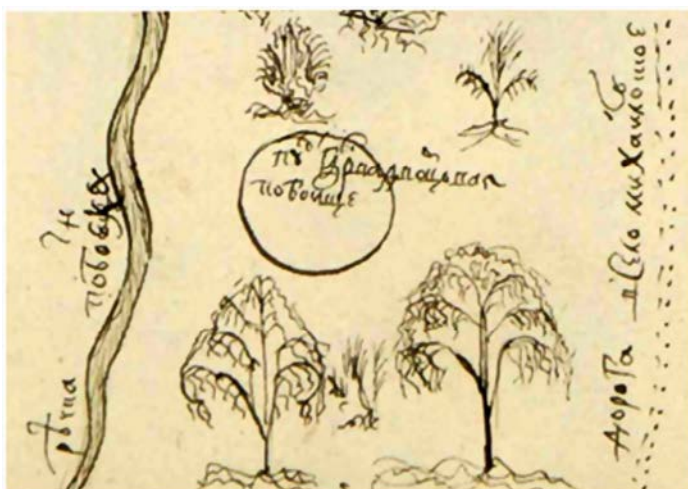
Рис. 7. Фрагмент чертежа № 343. Примеры указания владения объектами дворцовым ведомством и характеристик антропогенных объектов. Надписи на фрагменте (слева направо): «Речка Побоенка», «Пустошь Государева дворцовая.. Побоище», «Дорога в село Михайловское»

Цветовая окраска изображений и надписей, вероятно, представляет собой результат поиска способа упрощения передачи информации о большом количестве отображаемых на них однотипных объектов, принадлежащих одному и тому же владельцу. Так, для упомянутого выше чертежа № 401 таковыми являлись принадлежащие «Пречистому Саввино-Сторожевскому монастырю» тридцать девять пустошей [Материалы для истории..., 1997, С. 98–101, 130], причем, что особенно важно в данном случае, для всех них такой способ указания владельца является единственным.