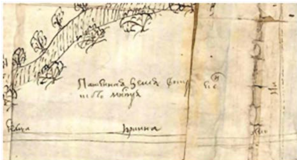
Рис. 5. Фрагмент чертежа № 369. Пример указания местоположений и владельцев объектов, принадлежащих субъектам духовного ведомства. Надпись в центре фрагмента: «Пашенная земля Воскресенского монастыря»

Условные обозначения, указывающие местоположения объектов, находящихся во владении частных лиц, выполнены чернилами красного цвета, а надписи, указывающие их владельцев, – черного.