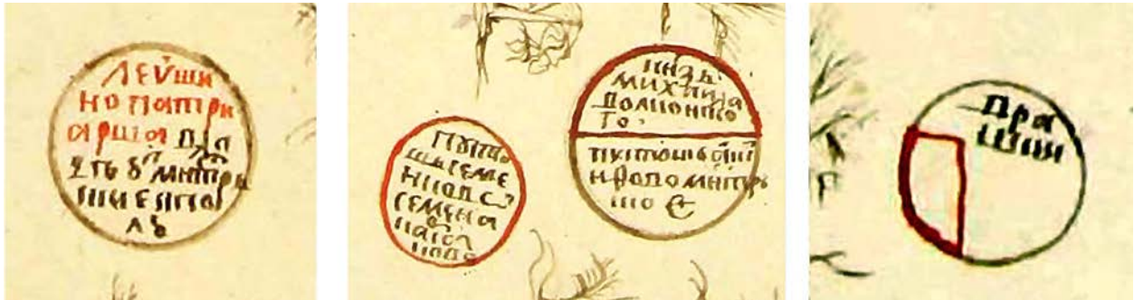
Рис. 9. Фрагменты чертежа № 341. Примеры частичного исполнения изображений объектов и надписей об их имущественной принадлежности чернилами красного и черного цветов. Надписи на фрагментах (слева – направо): «Левушино. Патриарша. Владуют монастырские и посадские люди»; «Пустошь Семенково. Семена Корсакова», «Князя Михаила Волконского. Пустошь Акинфово. Монастырское»; «Врашки»

На чертеже № 341 можно обнаружить и более сложные случаи указания владельцев имущества: в них чернила разных цветов используются для указания о пребывании объектов в долевом владении нескольких лиц. В качестве примеров рассмотрим несколько его фрагментов, приведенных на рисунке 9.