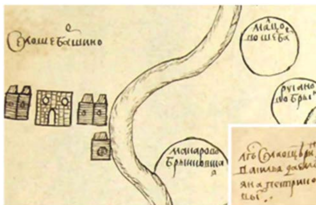
Рис. 3. Фрагмент чертежа № 348а. Примеры указания местоположений отдельных строений, кладбищ и иных объектов, а также персональных сведений о владельцах объектов.