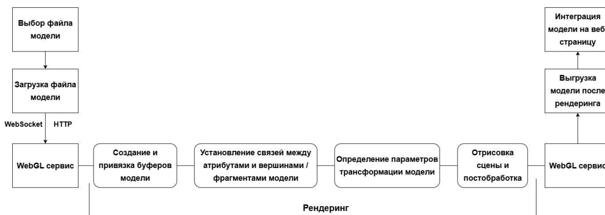
Рис. 2. Блок-схема принципа работы WebGL [Liu et al., 2024, p. 19] Fig. 2. A block diagram of how WebGL works [Liu et al., 2024, p. 19]

WebGL — кроссплатформенный API для отображения 3D-графики в браузере. WebGL исполняется как элемент HTML5 и поэтому является полноценной частью объектной модели документа (DOM API) браузера. Данная технология позволяет создавать интерактивные и адаптивные модели для их дальнейшего отображения в браузере [Cantor, Jones, 2012]. Структурно принцип работы WebGL можно представить в виде схемы, приведенной на рис. 2.