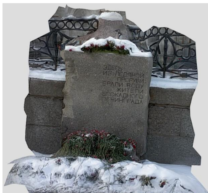
Рис. 5. Полноэкранное представление результатов пространственного моделирования объектов (выполнено авторами)