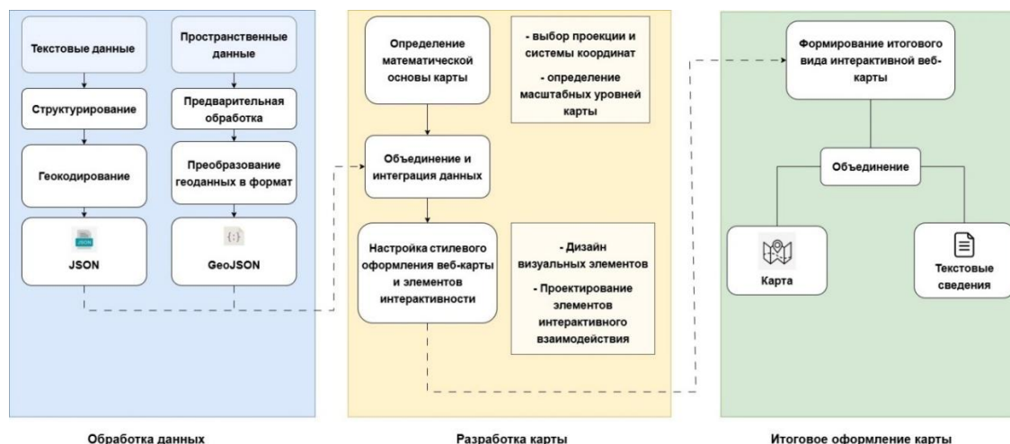
Рис. 1. Обобщенная технологическая схема процесса создания веб-карт с объектным наполнением [Wang et al., 2024, p. 2160]