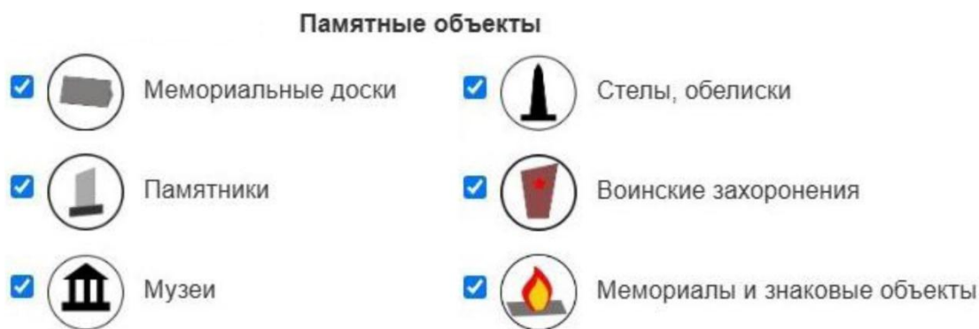
Рис. 3. Результат реализации настройки параметров визуального отображения объектов на интерактивной карте в контроллере слоев (выполнено авторами) Fig. 3. The result of the implementation of the settings for the visual display of objects on an interactive map in the layer controller (made by the authors)

Отдельно в текстовый файл формата JavaScript с информацией об объектах в раздел для размещения модели добавлялся ранее скопированный с Sketchfab html-код. Благодаря этому коду осуществляется загрузка сформированных моделей и их подключение во всплывающее окно объекта. Загруженная во всплывающее окно модель активируется по нажатию, присутствует возможность ее полноэкранного отображения. Результат оформления всплывающего окна и загрузки пространственной модели приведен на рис. 4–5.