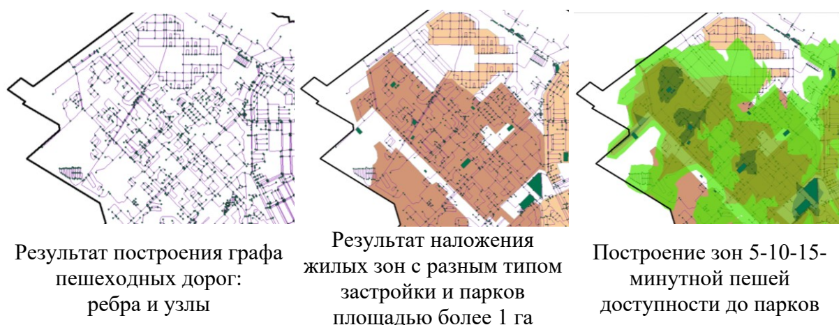
Рис. 1. Процесс построения зон пешей доступности до благоустроенных парков площадью более 1 га

Дальнейшая оценка пешей доступности проводилась путем вычисления площади жилых районов, входящих в разные зоны. Из предварительно оцифрованной схемы функционального зонирования Генерального плана г. Владикавказ были взяты полигоны следующих зон: жилой индивидуальной застройки, жилой среднеэтажной застройки, жилой малоэтажной застройки, жилой многоэтажной застройки. Данные зоны мы считаем «жилыми районами».