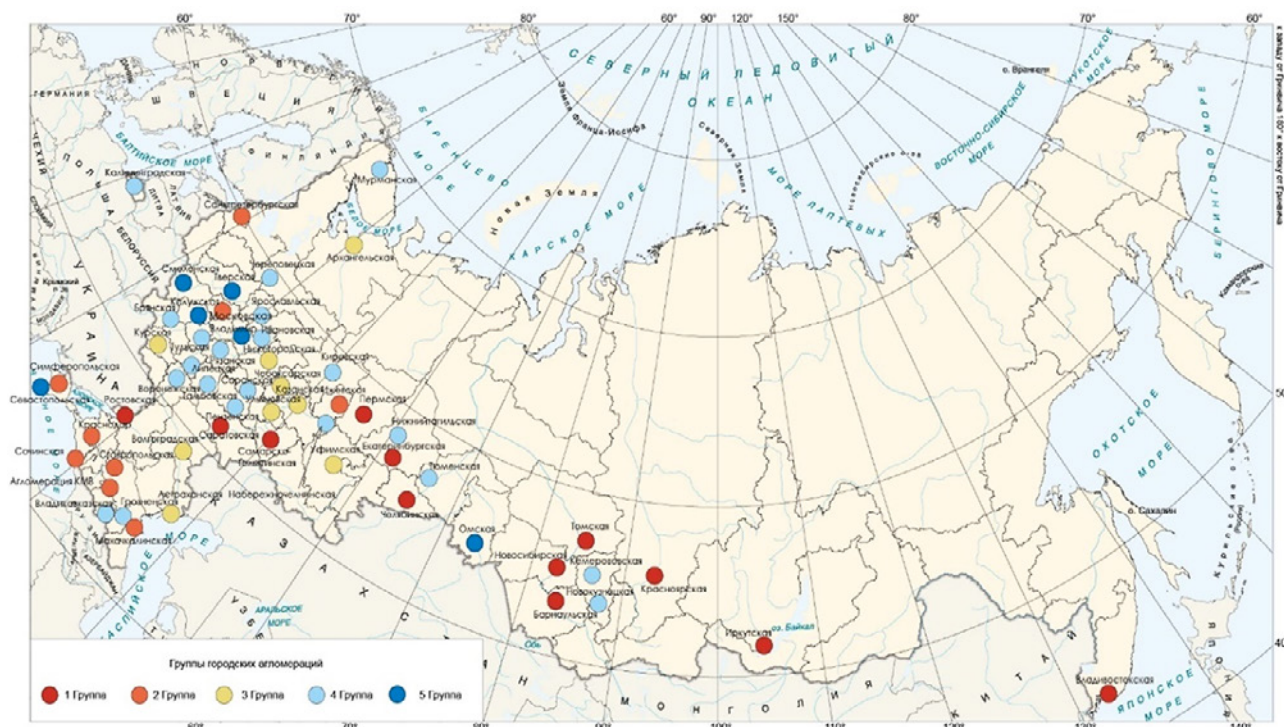
Рис. 2. Пространственная дифференциация групп городских агломераций по степени разработанности нормативных документов