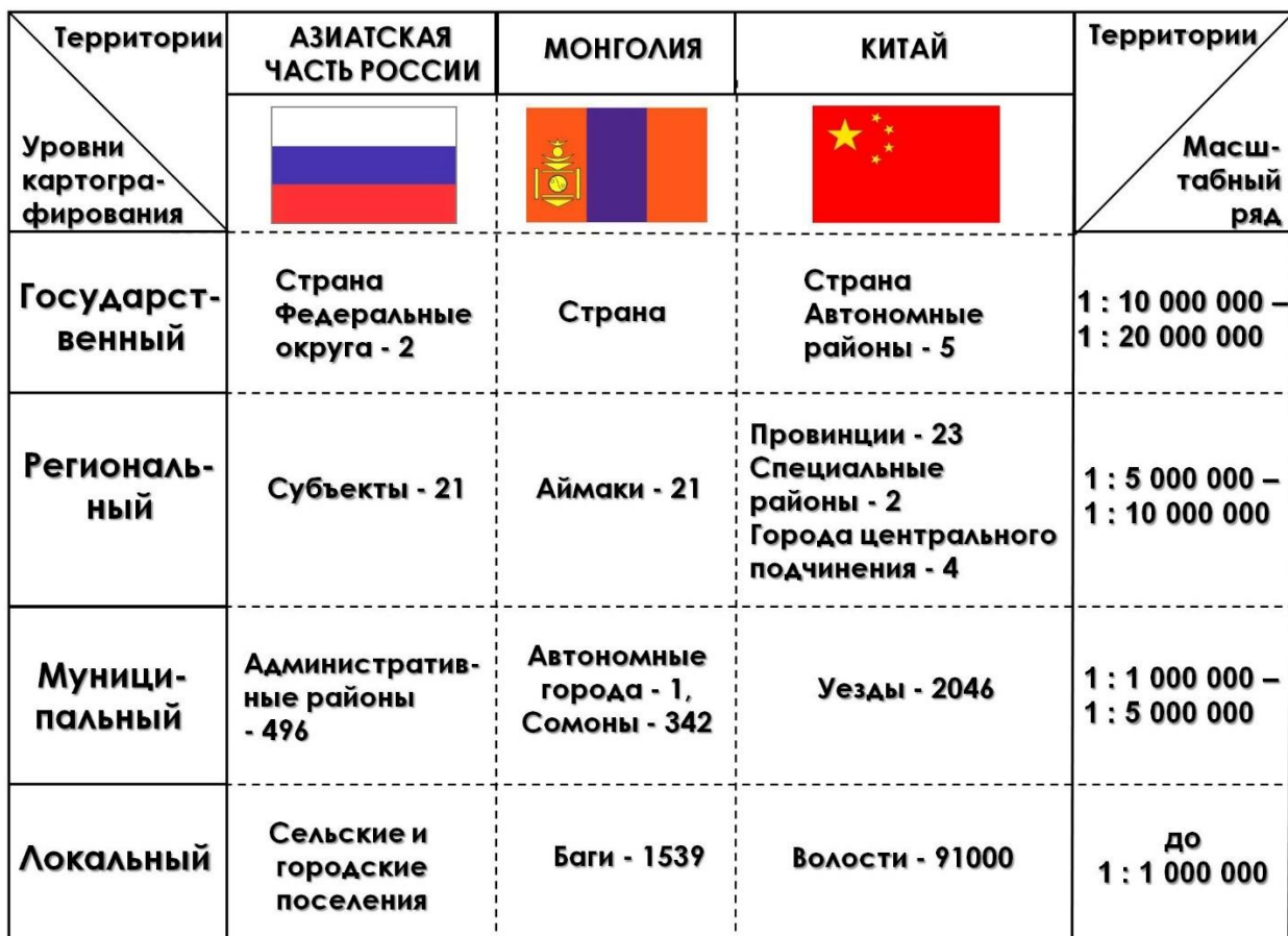
Рис. 2. Уровни картографирования территории Fig. 2. Territory mapping levels

При разработке содержания карт ставится задача показать фактическое состояние картографируемого явления или процесса, подчеркнуть закономерности в его развитии, по возможности осветить динамические аспекты.