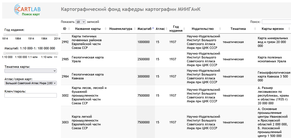
Рис. 1. Интерфейс сайта картографического фонда кафедры картографии МИИГАиК